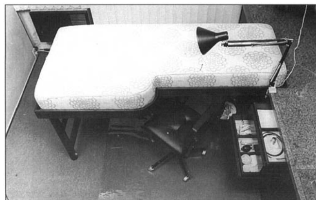
Fig. 3 - Outra versão da mesma mesa, com gabinete disposto transversalmente.