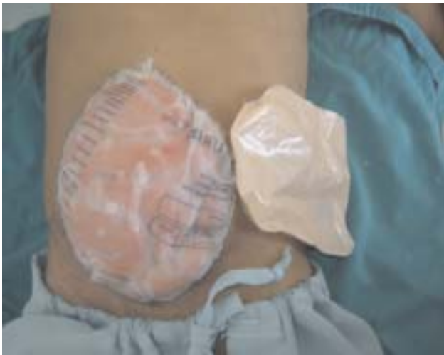
Figura 3 – Fotografia demonstrando paciente em 8º dia de peritoneostomia com Bolsa de Bogotá, apresentando também ileostomia (visão superior).