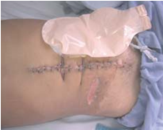
Figura 6 – Fotografia demonstrando o fechamento da parede abdominal no 30º dia de peritoneostomia (visão superior).