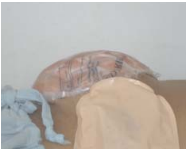
Figura 4 – Fotografia demonstrando paciente em 8º dia de peritoneostomia com Bolsa de Bogotá, apresentando também ileostomia (visão de perfil).

cientes (3) . Em nossa casuística houve fistulização em um (8,3%) paciente, provavelmente, conforme relato da literatura, em função da isquemia intestinal. Observamos ainda, que esse risco de fistulização ocorre ainda em função de termos necessidade de dissecar alças e liberar aderências nas sucessivas laparotomias.