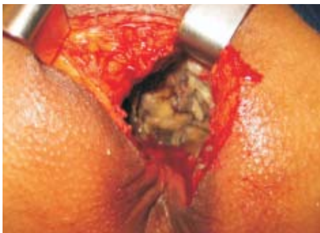
Figura 1 - Aspecto operatório do debridamento: necrose perineal profunda.

Após o término da antibioticoterapia e melhora do estado geral, o paciente foi submetido à colostomia em alça do cólon transversal com anestesia local e sedação e debridamento da ferida perineal. Durante o ato operatório, observou-se extensa necrose da musculatura do assoalho pélvico, esfínteres anais, próstata e parede anterior do reto (figura 1). Realizou-se debridamento extenso destas estruturas. Apresentou evolução satisfatória, sem queda do hematócrito. Iniciou oxigenoterapia hiperbárica 48 horas após o debridamento. Em 2 semanas houve melhora da ferida perineal e identificou-se prolapso da boca distal da colostomia do transversal. Devido à dificuldade no manuseio das placas da estomatoterapia, foi submetido à correção do prolapso e transformação da colostomia em alça para terminal. Apresentou boa evolução pós-operatória e realizou tratamento com oxigenoterapia hiperbárica para acelerar a cicatrização da ferida perineal (figura 2).