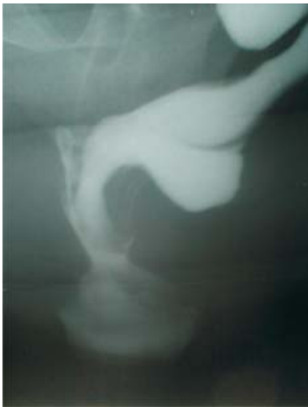
Figura 2 - Defecografia mostrando a presença de retocele posterior associada à intussuscepção retoanal (imagem de taça) com esvaziamento retal incompleto.

clínica de dor para tratamento suportivo da dor crônica persistente. Foi iniciado também acompanhamento psiquiátrico.