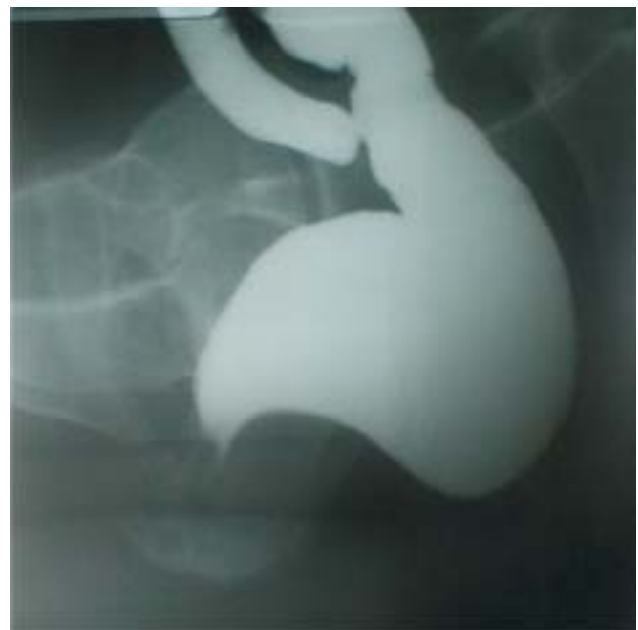
Figura 1 - Defecografia mostrando volumosa retocele posterior durante esforço defecatório.

O paciente foi encaminhado para sessões de biofeedback , na tentativa de reestabelecer a sinergia do assoalho pélvico e diminuir o quadro algico persistente. Após 12 sessões, o paciente relatou melhora discreta da disquezia e continuou mantendo dor anoperineal, porém de menor intensidade. Diante destes resultados, optou-se por encaminhamento para a