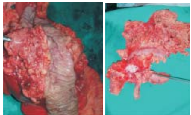
Figura 2 - Produto de gastroduodenopancreatectomia.