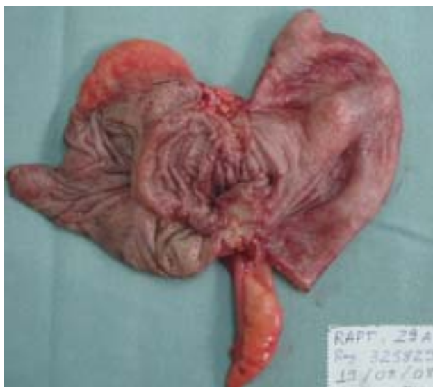
Figura 5 - Segmento ileocecal estenosado por endometriose intestinal.

A maioria dos pacientes portadores de bezoar relata vago desconforto epigástrico (80%). Estes podem relatar também plenitude, náuseas, vômitos,