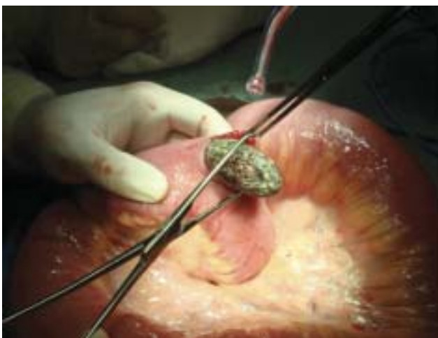
Figura 3 - Iletomia com remoção de fitobezoar.