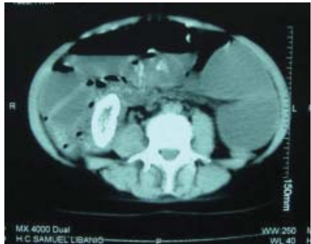
Figura 2 - TC abdome revelando massa em região ileocecal.

re em 90% dos casos. Outros segmentos afetados mais raramente são: o apêndice, íleo e ceco em 7% dos casos, e intestino delgado em 3% dos casos. (2,5)