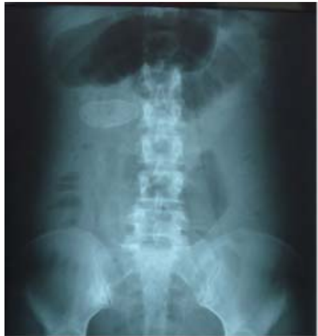
Figura 1 - Fitobezoar ao RX abdome.

O intestino é envolvido em aproximadamente 10% dos casos de endometriose sendo que a porção mais comumente afetada é o retossigmoide, o que ocor-