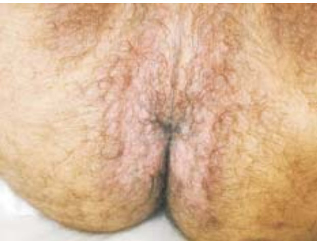
Figura 4 - Remissão das lesões após tratamento com prednisona.