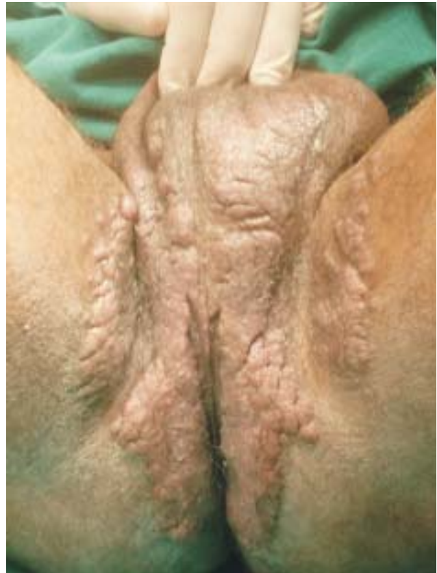
Figura 2 - Lesão vegetante e exudativa em região perianal e perineal.

Realizamos biópsia e anatomopatológico das lesões cuja microscopia evidenciou fragmentos de pele exibindo acantose, discreta papilomatose e alteração