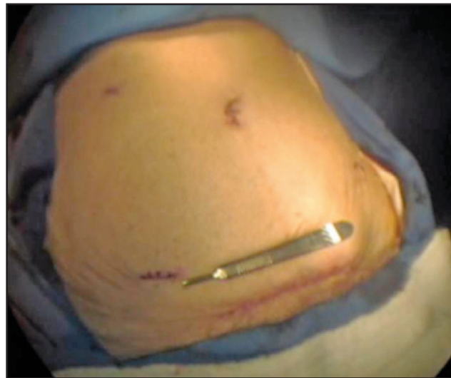
Figura 1 - Aspecto do abdome após cirurgia laparoscópica.

O estudo anatomopatológico da peça mostrou um adenocarcinoma moderadamente diferenciado, invasor até a muscular própria, metastático em 2 de 12 linfonodos dissecados (pT2pN1M0).