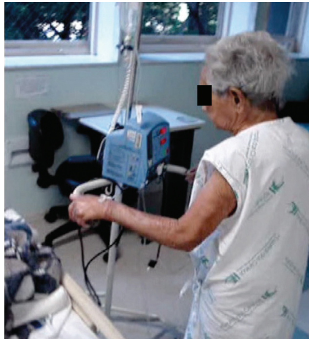
Figura 4 - Primeira dia pós-operatório – estímulo à deambulação.

trauma anestésico-cirúrgico, em razão de uma possível curta expectativa de vida. Há relatos que demonstram resultados desfavoráveis em grandes cirurgias para estes pacientes quando comparados aos mais jovens 4 . Outros estudos mais antigos condenaram a intervenção para CaCR em idosos devido a resultados ruins em curto e longo prazo, sendo reportadas taxas de morbidade entre 31 e 55% e de mortalidade entre 2 e 16% 5 . Contudo, avanços nas técnicas anestésicas e cirúrgicas, bem como nos cuidados pré e pós-operatórios, vêm mudando esse cenário, o que permite melhores resultados e a realização de cirurgias mais amplas em pacientes idosos selecionados.